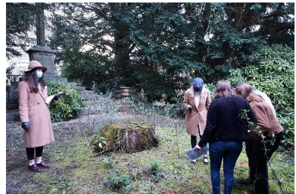
Recherche des indices sur la scène de crime, enquêtrices

https://www.tevi.tv/BTS-Tourisme-Lyce-Bon-Sauveur-de-St-Lo-50_v2926.html