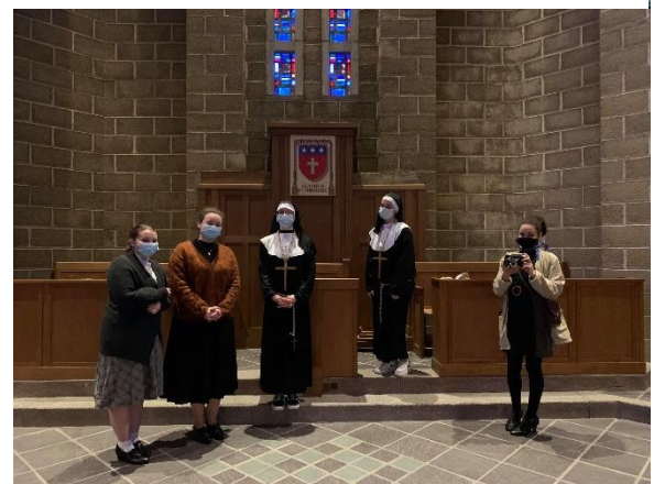
Élèves de BTS dans leur rôle (bibliothécaires, bonnes sœurs et journaliste)