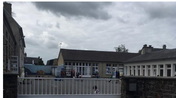
Ecole maternelle Catherine Dior, La Haye Pesnel

J'ai adoré travailler avec les enfants entre 3 et 4 ans. Je me sentais à l'aise avec les enfants et le personnel.