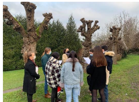
Journaliste annonçant le meurtre