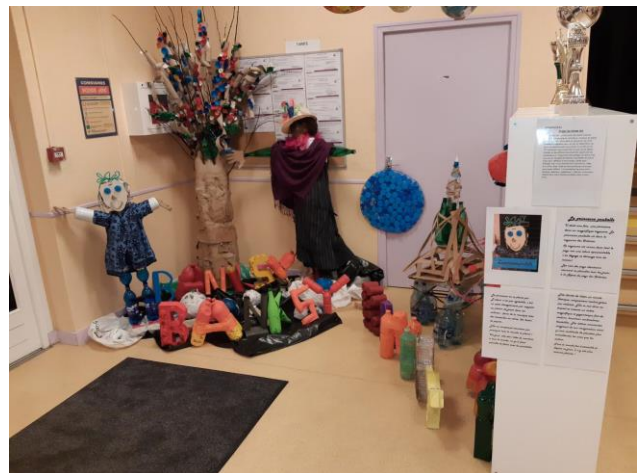
L'expo le conte de la Princesse Poubelle

Vous pourrez ainsi redécouvrir le gymnase, la cour de l'école primaire et le foyer « jeux » du collège !