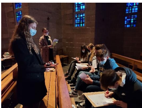
Exercice d'écriture manuscrite